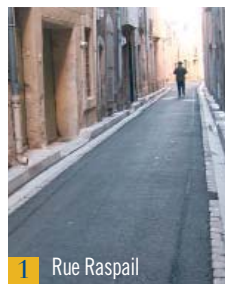
1 Rue Raspail

En avril, la sortie du parking Voltaire, rue du Commandant Allengry jusqu'à l'ancienne voie d'intérêt local, a été entièrement refaite.