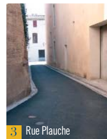
3 Rue Plauche