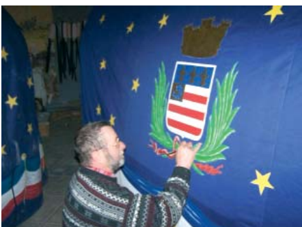
La Ville a commandé à M. André Sabat la peinture de la robe du Poulain réalisée par M. Jean Simon, tous deux artisans piscénois.

Le 16 février, pour le carnaval des écoles, plus de 700 enfants ont défilé derrière le petit Poulain. Après un tour de ville endiablé, le jugement et la crémation du Roi Carnaval, ils ont rejoint leurs écoles pour partager le goûter offert par la municipalité. Les festivités de Mardis Gras se sont poursuivies dans la bonne humeur générale, faisant vivre la Ville au rythme des danses et des pas du Poulain.