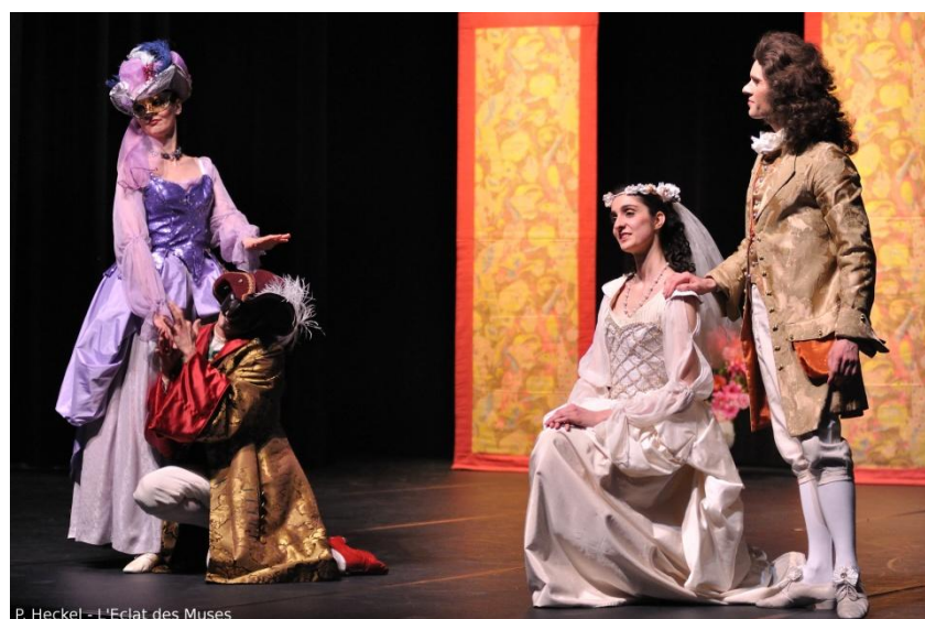
P. Heckel - L'Eclat des Muses